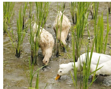
ABB. 4 Enten entfernen Unkräuter und Schädlinge.

gesamten Produktion. Das Wasser muss langsam fließen, damit einerseits die Algenbildung verhindert wird, andererseits aber auch keine Bodennährstoffe ausgeschwemmt werden. Findige Bauern nutzen die temporären Gewässer schon lange zur Zucht von Fischen und Krebsen, die den Speiseplan zusätzlich bereichern. Auch eine Ko-Kultivierung der Reispflanzen mit dem Algenfarn der Gattung Azolla verbessert auf vielen Feldern den Ertrag. Die kleine Schwimmpflanze beherbergt in ihren Blatthöhlen Cyanobakterien der Gattung Anabaena , die den Luftstickstoff fixieren kann, so dass Azolla zu dichten Matten zwischen den Reispflanzen heranwachsen kann. Nach der Reisernte wird der Algenfarn als Gründünger in den Boden eingearbeitet, wo der fixierte Stickstoff wieder freigesetzt wird und die Fruchtbarkeit des Bodens erhöht. Das Ökosystem „Reisfeld“ kann aber noch im Sinne der Menschen erweitert werden. Statt Reisschädlinge wie bestimmte Käfer und Schmetterlingsraupen durch teure Insektizide fernzuhalten, nutzen die Bauern vielerorts schon tierische Helfer (Abbildung 4): Ganze Entengeschwader werden per LKW in die Reisfelder gefahren, wo sie aus eigenem Antrieb die Reispflanzen von