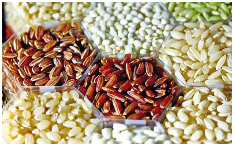
ABB. 2 Reis gibt es in den verschiedensten Größen, Formen und Farben.

Als Wildform gilt Oryza rufipogon , der nicht verwechselt werden sollte mit dem im Handel erhältlichen „Wildreis“, denn letzterer gehört zur amerikanischen Gattung Zizania . Oryza rufipogon kommt natürlicherweise in den Feuchtgebieten Südasiens und Südchinas vor. Domestiziert