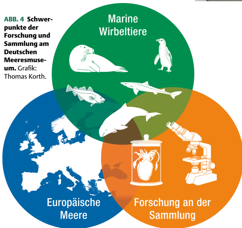
ABB. 4 Schwerpunkte der Forschung und Sammlung am Deutschen Meeresmuseum. Grafik: Thomas Korth.

ponate konzentriert. Bedeutsames Sammlungsgut konnte in nun fast 70 Jahren zu den Themen Meeresbiologie, Fischerei, Meereskunde und Meeresgeologie gewonnen werden. Insbesondere die Schweinswalsammlung des Deutschen Meeresmuseums gehört zu den größten ihrer Art in Europa. Zusätzlich wurde die Fischsammlung durch Aufhellpräparate (Abbildung 3) bereichert. Mit diesen transparenten Fischen werden die vergleichende Entwicklungsgeschichte der einzelnen Arten und die Entwicklung von der Larve bis zum ausgewachsenen Fisch nachvollzogen und sichtbar gemacht. In der Forschung konzentriert sich das Deutsche Meeresmuseum auf die Bereiche