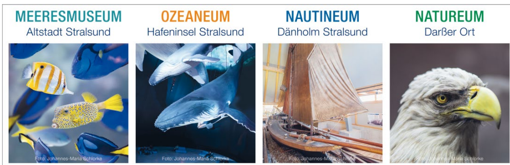
ABB. 2 Ausstellungsinhalte und Aquarien der Stiftung Deutsches Meeresmuseum.