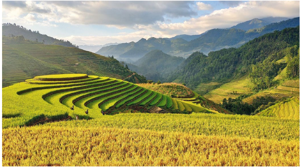
ABB. 3 Reisanbau in Vietnam: Hügel werden zu Terrassen umgestaltet, um Staunässe zu ermöglichen.

Trotz seiner Nachteile überwiegt der Nassanbau mit 80 Prozent der