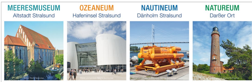
ABB. 1 Die Ausstellungshäuser der Stiftung Deutsches Meeresmuseum.

Als noch junges Museum ist die Sammlung derzeit auf unsere lokalen Küstenbewohner und tropische Ex-