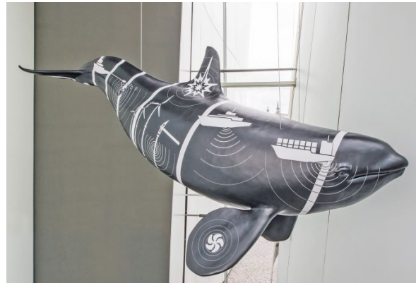
ABB. 6 Ein „Maori-Schwertwal“ – die Lärmeinflüsse im Meer haben ihre Spuren in Form von Tätowierungen auf dem Tier hinterlassen.