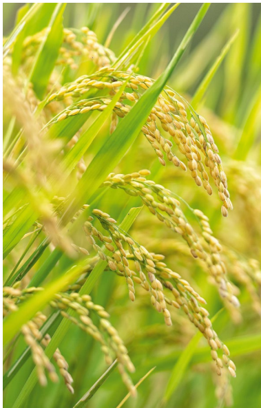
ABB. 1 Oryza sativa -Pflanzen mit reifen Ähren.

Als Grundnahrungsmittel hat die Reispflanze nicht nur die wachsende Weltbevölkerung gestützt, sondern sie hat gerade in Asien die kulturelle Entwicklung mitgeprägt. Menschen schätzen die stärkehaltigen Samen, nutzen aber auch andere Teile der Reispflanze für Gebrauchsgegenstände wie Matten oder Hüte. In hügeligen Regionen hat der Reisanbau die Landschaft verändert, und zukünftig wartet er mit neuen Konzepten zur Ko-Kultivierung auf. Längst haben Genetiker die Reispflanze mit neuen Eigenschaften ausgestattet, die den Anbau erleichtern und die Qualität verbessern.