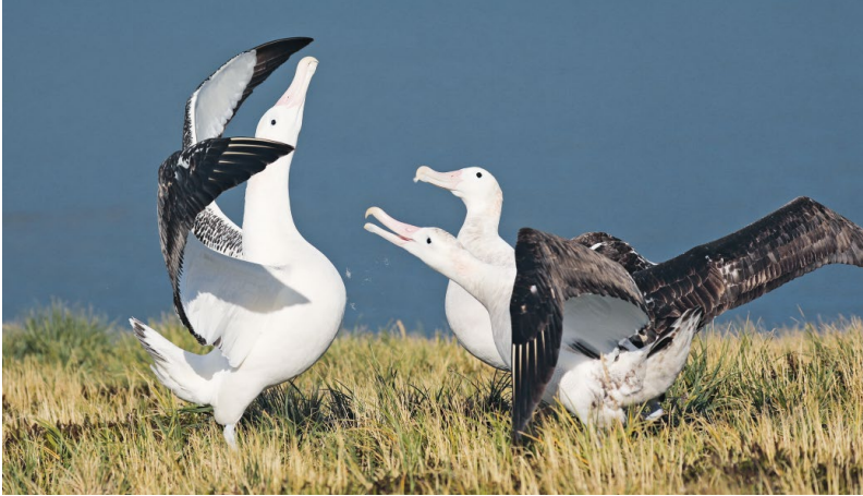
ABB. 6 Die Prince-Edward-Inseln beherbergen 44 Prozent des Weltbestandes des Wanderalbatrosses, der in lockeren Kolonien auf den Küstenebenen der Inseln brütet.