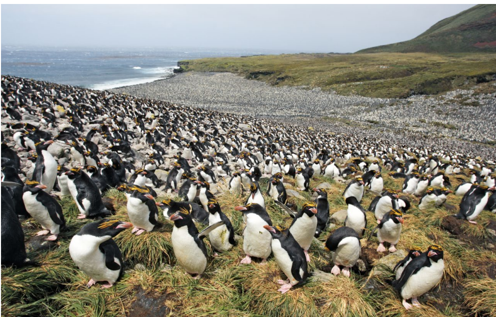
ABB. 5 Goldschopfpinguine drängen sich auf der Kildalkey-Bucht aneinander.

durchgehend ab. Die Anzahl der Jungen, die jedes Jahr auf Marion geboren wurden, fiel von mehr als 3.000 in den 1950er Jahren auf kaum 300 in den 1990er Jahren. Während der letzten beiden Jahrzehnte kam es jedoch zu einer Erholung auf bis zu 800 Jungen pro Jahr.