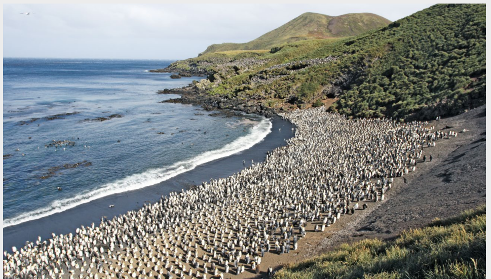
ABB. 8 Die Boggelbucht auf Prince Edward ist der Hauptbrutplatz des Königspinguins.

Das Monitoring der Bestände von marinen Beutegreifern ist ein wertvoller Indikator für die Gesundheit des umliegenden Südpolarmeer. Über die letzten Jahrzehnte haben die Bestandszahlen der Goldschopf- und der Felsenpinguine um 30 Prozent beziehungsweise 70 Prozent abgenommen. Als wahrscheinliche Ursache gelten lokale ozeanographische Veränderungen um die Inseln. Die Anzahl der subantarktischen Pelzrobben ist ebenfalls in den letzten 15 Jahren stark gesunken ohne einen offensichtlichen Grund. Die Bestandszahlen der Königspinguine (Abbildung 8) blieben bislang weitgehend konstant. Allerdings wird angenommen, dass sie aufgrund der zunehmenden Klimaerwärmung abnehmen werden, da die Königspinguine für ihre Jungen vorwiegend an der antarktischen Polarfront rund 300 Kilometer südlich der Inseln auf Nahrungssuche gehen. Wenn sich diese Front weiter nach Süden verlagert, müssen die Königspinguine zunehmend längere Strecken zurücklegen, um Nahrung für ihre Küken zu finden.