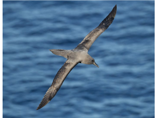
ABB. 7 Rund 2.800 Dunkelalbatrosse brüten auf den Inseln – ein wichtiger Lebensraum für diese bedrohte Art.

Insel lebten, stark reduziert (siehe „Ein Negativbeispiel biologischer Bekämpfung“). So ist die Dichte besetzter Bruthöhlen auf Marion um eine Größenordnung niedriger als auf Prince Edward, wo es keine eingeführten Säugetiere gibt. Die Marion-Insel hat nichtsdestotrotz mehr als 300.000 Sturmvogel-paare, vornehmlich Blausturm-vogel ( Halobaena caerulea ) und kleine Entensturm-vogel ( Pachyptila salvini ). Die Ausrottung der Katzen führte zu einer Erholung der Sturm-vogelzahlen, die jedoch geringer als erwartet ausfiel, weil die Vögel auch von den Mäusen angegriffen werden. Glücklicherweise gibt es inzwischen die Mittel und Möglichkeiten, um die Mäuse auf Marion auszurotten – eine einmalige Maßnahme, die es den Seevogelbeständen der Insel ermöglichen soll, wieder ihre frühere Größe zu erlangen.