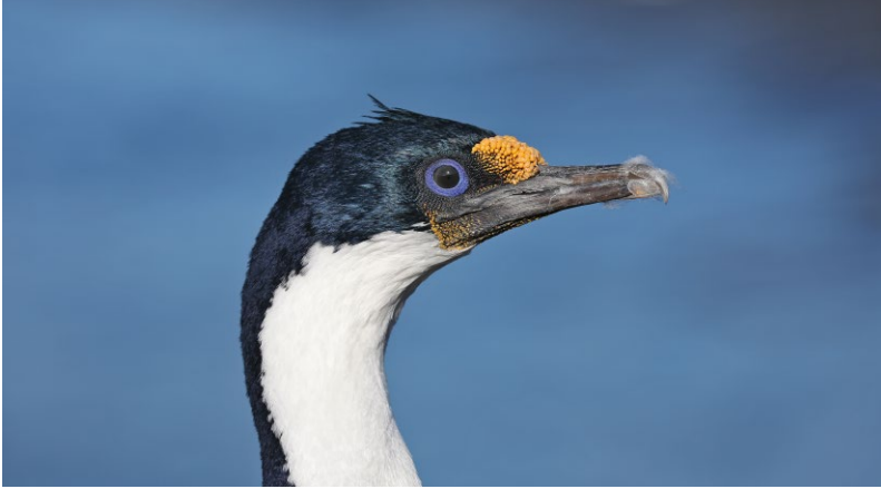
ABB. 3 Die Crozetscharbe brütet auf Klippen der Inseln Prince Edward, Marion und Crozet.