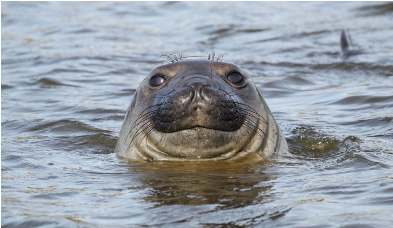
ABB. 4 Ein weiblicher Seeelefant blickt über die Wellen.