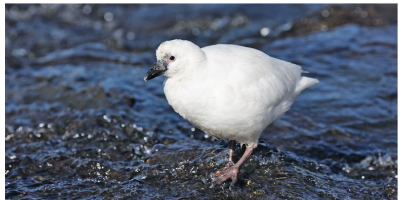
ABB. 2 Der Schwarzgesicht-Scheidenschnabel ( Chionis minor ) ist der einzige Landvogel der Insel. Als entfernte Verwandte der Austernfischer sind die einzigen beiden Scheidenschnabelarten der Welt auf die südpolare Inselwelt beschränkt. Sie ernähren sich und ihre Jungen mit Nahrung, die sie von Seevögeln klawen.

Die subantarktische Inselgruppe liegt 2.000 km südlich der afrikanischen Südküste. Die beiden Hauptinseln Marion und Prince Edward liegen 20 km voneinander entfernt. Karte: T. Riffel.