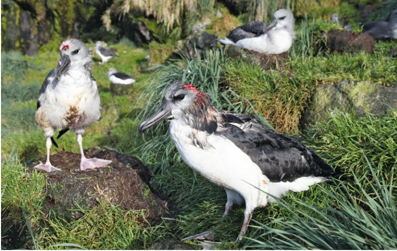
ABB. 9 Wanderalbatrossküken mit Kopfwunden, die ihnen von Mäusen beigebracht wurden.

Programm zur Ausrottung der Katzen auf der Insel Marion gestartet. Die Ausbringung des Katzenstaupevirus halbierte den Bestand bis 1979. Nachhaltiges Jagen und Fallenstellen in den folgenden zehn Jahren führte im Jahr 1991 zur Ausrottung der Katzen. Dies ermöglichte eine Erholung der höhlenbrütenden Sturmvogelbestände. So kehrten sogar die beiden zuvor auf der Insel ausgestorbenen Lummensturmvogel und die Graurückensturmschwalbe als Brutvögel auf die Insel zurück.