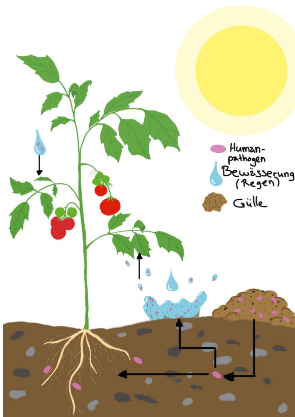
ABB. 1 Mögliche Eintrittswege von Humanpathogenen auf und in Pflanzen.

Nährstoffmangel und die insgesamt für Humanpathogene suboptimalen Umstände im Boden machen Anpassung besonders wichtig. Diese ist über veränderte Genexpression möglich, die wichtige Prozesse reguliert. In S. enterica sind unter anderem Metabolismus und Peptidsynthese angekurbelt [6], während in