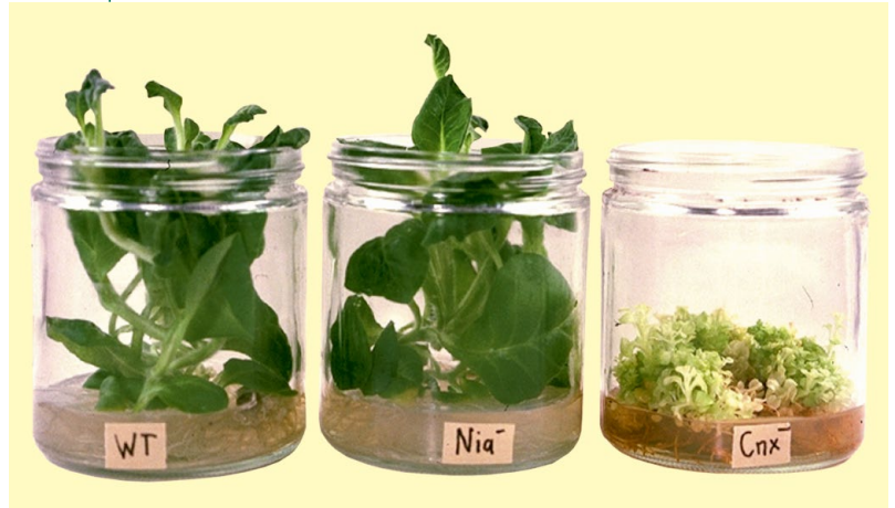
ABB. 2 | MUTANTEN DER PFLANZE NICOTIANA TABACUM

Die Pflanze Nicotiana tabacum war in den 1970er und 1980er Jahren ein hervorragendes Modellobjekt für genetische und zellbiologische Arbeiten unter definierten Laborbedingungen: links im Bild die nichtmutierte Wildtyp-Pflanze (WT), in der Mitte eine Pflanze mit einer Mutation im Nitratreduktase-Gen ( Nia - ), rechts Pflanzen mit einer Mutation in der Moco-Biosynthese ( Cnx - ). Der Verlust der Nitratreduktase-Aktivität wurde durch Anzucht auf Ammoniumsuccinat als Stickstoffquelle im Nährmedium kompensiert.