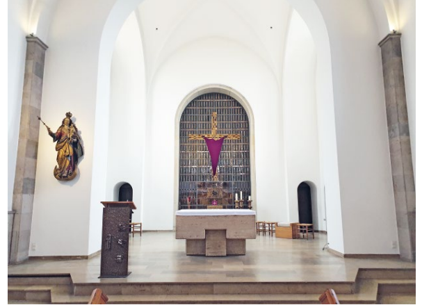
ABB. 6 Klosterkirche in der Passionszeit.

BB: Von „pädagogischem Konzept“ zu sprechen ist sicherlich etwas hoch gegriffen. Es handelt sich eher um einen „Pädagogischen Leitgedanken“. Wichtig ist uns zunächst, die