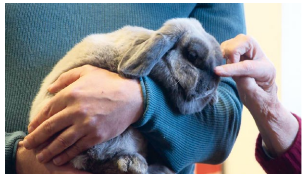
ABB. 5 Kaninchen können bei vielen Patienten ein Wohlgefühl auslösen und eignen sich deshalb für den Einsatz in Krankenhäusern und Altenheimen.

Da Kaninchen zwar als jagdbares Wild gelten, aber nicht dem Fleischverbot während der Fastenzeit unterliegen, wurden die ersten Kaninchenrassen in Klöstern gezüchtet. 1874 wurden in Deutschland die ersten Zuchtvereine gegründet, mit dem Ziel weitere Eigenschaften wie Pelzfarbe und -qualität, Endgröße sowie Ohrenlänge zu verändern. Vom „Deutschen Riesen“ bis zum zehnmal leichteren „Zwergkaninchen“ sind heute mehr als 90 Rassen bekannt, deren Standards vom Zentralverband Deutscher Kaninchenzüchter e. V. festgelegt werden.