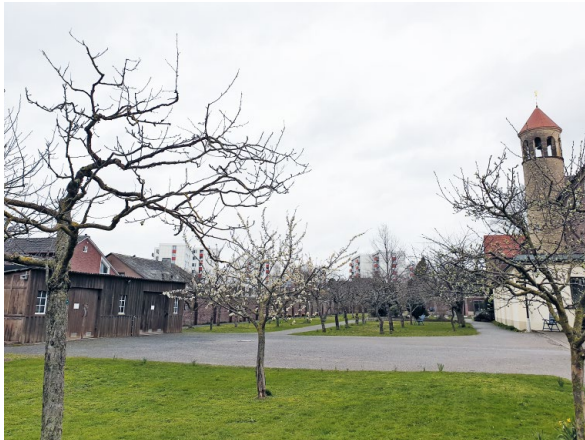
ABB. 1 Obstbaumanpflanzungen im Kapuzinergarten.

Die Gestaltung des Gartens orientiert sich nicht an der klassischen Einteilung von Klostergärten, wie etwa nach Inhaltsstoffen oder der