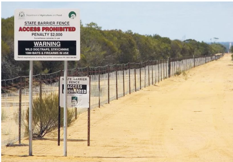
ABB. 4 Der rabbit-proof fence von 1904 soll heutzutage die Ausbreitung von Kaninchen, Dingos, Füchsen und Emus in Australien verhindern.

wo die Tiere so häufig gewesen sein mussten, dass sie schon den Phöniziern als charakteristische Art aufgefallen waren. Sie erinnerten die Händler an kleine Säuger ( Procavia capensis ), die in Afrika heimisch waren, aber nicht so lange Ohren und Hinterläufe hatten. So wurde die iberische Halbinsel zum „Land der Schliefer“, was nach Übersetzung ins Lateinische zu „Hispania“ wurde. Wer hätte gedacht, dass die spanische Nation ihren Namen den Langohren schuldet?