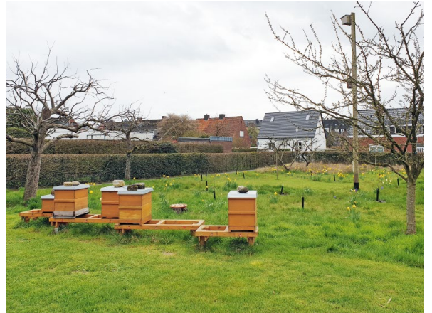
ABB. 3 Bienenstöcke und Blühwiese mit Frühblühern.