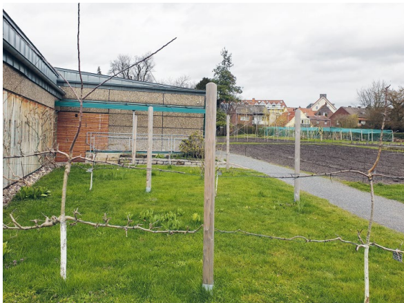
ABB. 2 Gepfropfte Apfelsorten.