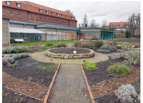
ABB. 4 Küchenkräuterareal.