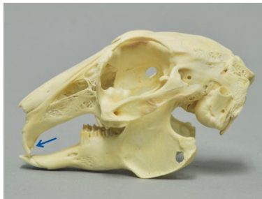
ABB. 2 Kaninchen Schädel mit den für Hasenartige typischen Stützähnen (Pfeil) hinter den Nagezähnen.

Die Bezeichnung Kaninchen umfasst viele verschiedene Gattungen aus der Ordnung der Hasenartigen (Lagomorpha), stellt selber aber keine systematische Gruppe dar. Die Urform ist das Wildkaninchen ( Oryctolagus cuniculus , Abbildung 1), das ursprünglich auf der iberischen Halbinsel, Südfrankreich und Marokko vorkam und vom Menschen vielerorts ausgewildert wurde. Im Vergleich zum Feldhasen ( Lepus europaeus ) sind Ohren, Hinterläufe sowie Schwanz des Wildkaninchens kürzer und der Körper insgesamt