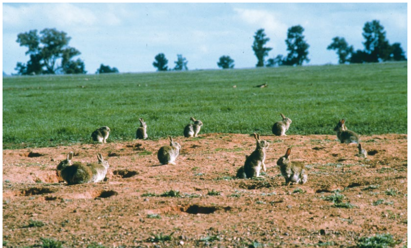
ABB. 3 Seit Kaninchen in Australien eingeführt wurden, haben sie sich übermäßig vermehrt und verdrängen einheimische Beuteltiere.

Die Geschichte der Kaninchen beginnt auf der iberischen Halbinsel,