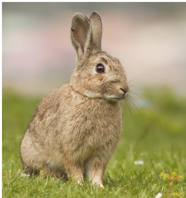
ABB. 1 Wildkaninchen sind insgesamt zierlicher als Hasen.

Zunächst war es zwar nur schmackhaftes Wildbret und lieferte einen schönen Pelz, aber gerade das flauschige Fell machte das Kaninchen besonders beliebt. So avancierte das flinke Langohr bald zum Streicheltier, für das sich nicht nur Kinder begeistern. In der pharmazeutischen Industrie haben die Tiere vielfach als sprichwörtliches Versuchskaninchen gedient. Seit vielen Jahren erkennt der Mensch aber auch den therapeutischen Nutzen der süßen Pelztier.