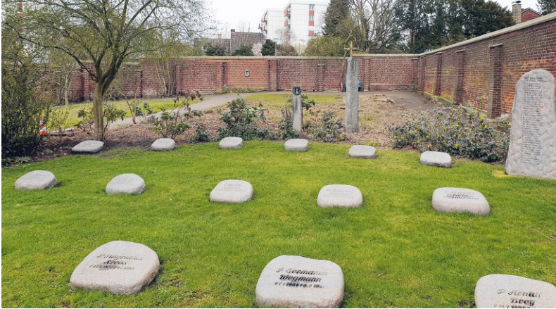
ABB. 5 Klosterfriedhof mit dem dahinter liegenden Bereich für Neuanpflanzungen von Obstbäumen.

Gesundheitswirkung der Pflanzen, sondern hat sich der Biodiversität verschrieben – so insbesondere auch durch regelmäßige Neuanpflanzungen hinter dem Klosterfriedhof (Abbildung 5).