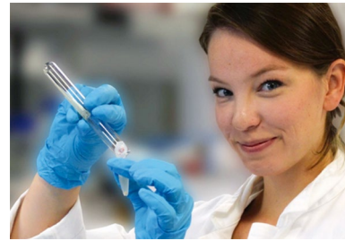
ABB. 2 Blogbeitrag einer 9-teiligen Serie. Beitrag verfügbar unter https://t1p.de/y4kf8

Die Blogserie „ Pauline und die Ausreißer “ beruhte auf einer unerwarteten Beobachtung in unserem CRISPR-Cas-Experiment (Abbildung 2, s. Artikel „Pauline und die Ausreißer“). Wir machten eine Fort-