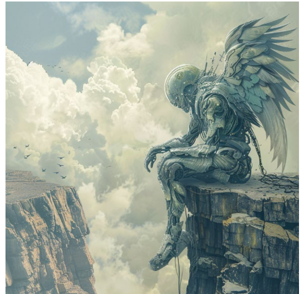
ABB. 6 Plakat zum Science Café „Wir CRISPRn uns durch die Apokalypse“. Abb. erstellt von BioWissKomm by Mid-journey.

In vielen Fällen legen von der DFG geförderte Forschungsverbände ihren Abschlussbericht in Form wissenschaftlicher Publikationen im