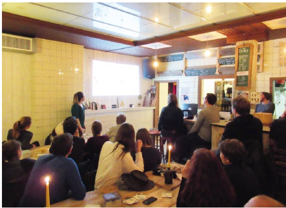
ABB. 4 Science Café in der Kasseler Kneipe Steckenpferd. Hier standen die Besucher/-innen teilweise auf der Straße, weil der Gastraum überfüllt war.

ABB. 3 YouTube-Video von Khalid Abdullah aus einer Serie von fünf Filmen. Film verfügbar unter https://t1p.de/4gd2f