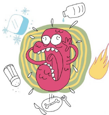
ABB. 1 Comic eines gestressten Bakteriums. Das Bild wurde auch bei Laborkursen verwendet, um den Stress bei der Bakterientransformation zu zeigen. Illustration: Lukas Kummer.

Ein ganz wesentlicher Beitrag war die Entwicklung eines einfachen, aber robusten CRISPR-Cas-Experiments zu Beginn der ersten Förderperiode. Dieser Laborversuch wurde in den Roadshows und bei anderen Veranstaltungen (Lehrerfortbildungen, Schul- und Öffentlichkeitskursen) sehr oft eingesetzt. Das Experiment wird inzwischen auch vielfach in anderen Schülerlaboren verwen-