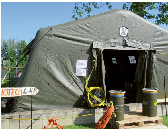
ABB. 5 Als S1-Labor auf dem Science Festival „Children of Doom“ diente ein angemietetes ABC-Sicherheitszelt der Bundeswehr.

ABB. 4 Science Café in der Kasseler Kneipe Steckenpferd. Hier standen die Besucher/-innen teilweise auf der Straße, weil der Gastraum überfüllt war.